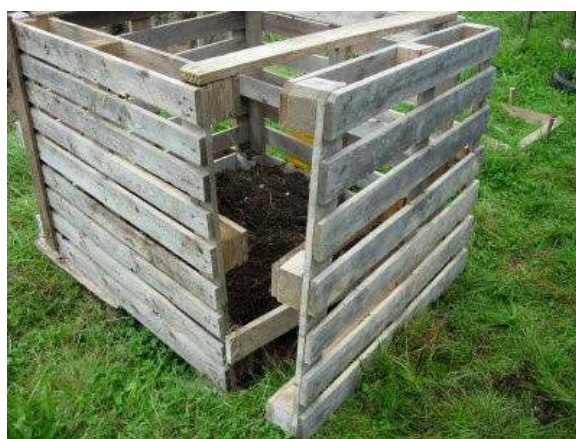
Composthoop gemaakt van pallets

Bladaarde is eigenlijk ook heel simpel te maken. Verzamel in de herfst goed verteerbare bladeren van bijvoorbeeld berken of eiken en maak er berg van in een hoek van je tuin. Dek af met gaas, of zet er gaas omheen, zodat het blad niet wegwaait. Al vrij snel zal de hoop vol regenwormen en andere diertjes en schimmels zitten, die de bladeren in minder dan een jaar tijd afbreken tot rulle, vruchtbare aarde. Ideaal als mulch om de bodem mee te bedekken en je planten mee te voeden.