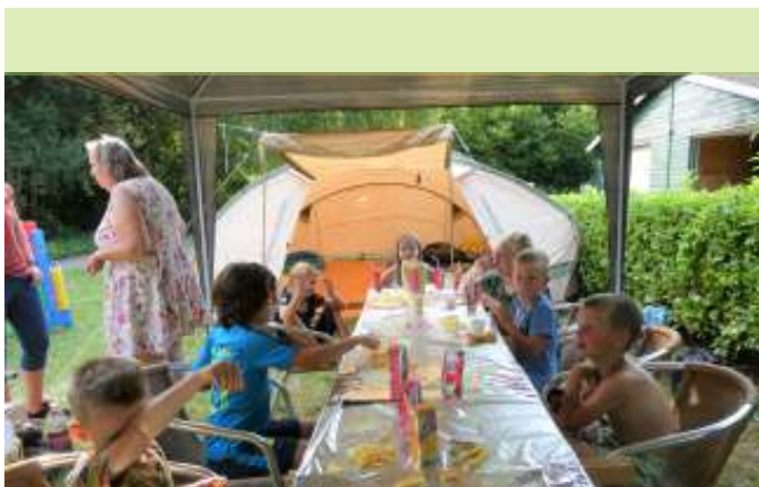
Op 23 juli stond er een tent bij het verenigingsgebouw. Kinderen van Thurlede brachten er de nacht door. Maar eerst patat natuurlijk!

Ik was naïef en dacht binnen een paar maanden een schuur vol te oogsten en geen AH groenten meer nodig te hebben. Ik ga u niet vervelen met al mijn mislukkingen. Ik volsta met: "De slakken, koolwitje, woelmuizen, wortelvlieg en duiven hebben gewonnen