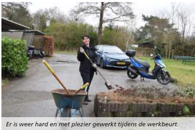
Er is weer hard en met plezier gewerkt tijdens de werkbeurt.

Het bestuur heeft de plannen voor 2024 al klaar. Opnieuw willen we containers bestellen waarin tuinders hun grof vuil kwijt kunnen (houd je e-mail in de gaten voor de data). Tuin 68, die nu in gebruik is als moestuin, willen we na een verbouwing aanbieden als tuin zonder huisje. Omdat de contacten met Irado zeer waarschijnlijk veranderen, lopen we daar alvast op vooruit door een post op te nemen voor de kosten die gemaakt moeten worden voor het kappen van bomen.