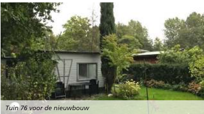
Tuin 76 voor de nieuwbouw