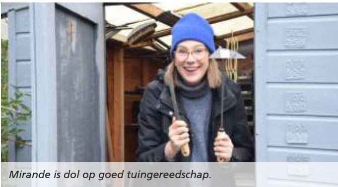
Mirande is dol op goed tuingereedschap.