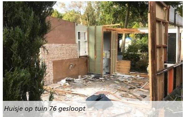
Huisje op tuin 76 gesloopt