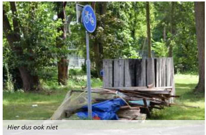
Hier dus ook niet

Daarom een aantal tips voor het onderhoud. Haal boomwortels etc. bij de put weg, zodat deze niet beschadigd raakt. Als de put regelmatig volloopt, is de put vaak lek op de plek waar de waterleiding door de wand van de put loopt. Dit kun je dichten met speciaal tape en/of schuim. Ook kan de put te laag liggen ten opzichte van de tuin. Verhoog daarom de putrand en zorg voor een goede afwatering rondom de put. Schade aan de watermeter is voor de vereniging.