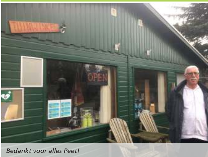
Bedankt voor alles Peet!

Nadat er meerdere ijsvogels gesignaleerd waren in het Prinses Beatrixpark die geen broedplek konden vinden, kwam onze eigen Ben van den Broek in actie en met succes. Vorig voorjaar hebben verschillende verenigingen, zoals de Koninklijke Nederlandse Natuur Vereniging en Stichting Beatrixpark Schiedam, de handen ineen geslagen om een broedwand te realiseren. De locatie is geheim, maar er is inmiddels een filmpje te bekijken op Twee. Als er te veel mensen komen kijken, stoort dat de broedende ijsvogels. Wie ijsvogels wil zien, kan naar de kijkewand bij de Beukenhof.