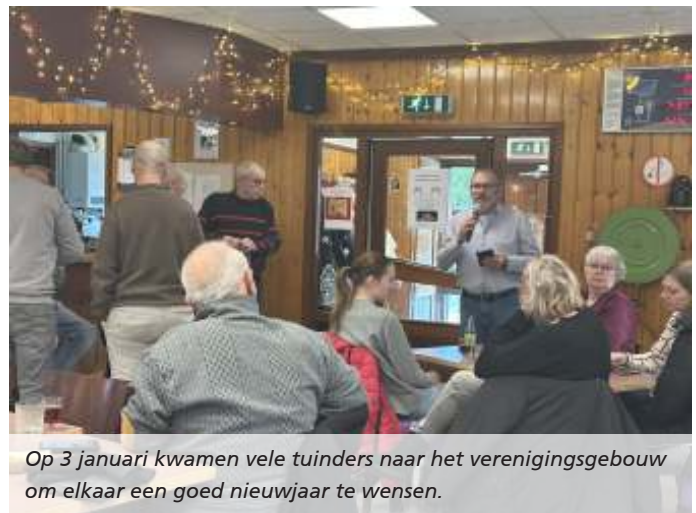
Op 3 januari kwamen vele tuinders naar het verenigingsgebouw om elkaar een goed nieuwjaar te wensen.

Verplaats stapels hout en stenen voorzichtig: kikkers en padden gebruiken deze vochtige plekken vaak om te schuilen..